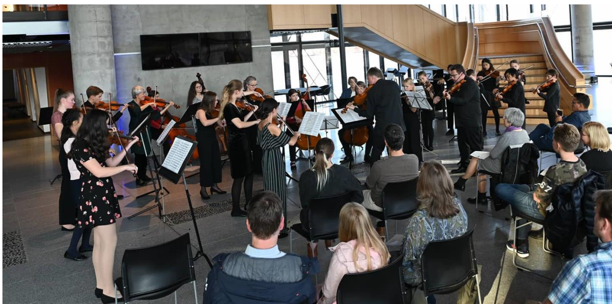
Konsert i Stavanger konserthus, søndag 27.september.