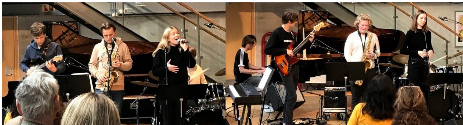
Bilder fra konsert i november – Sandnes kulturhus 20 årsjubileum